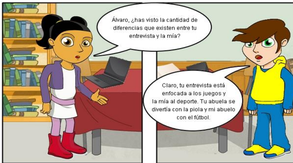
Ilustración. ¿Diferencias en entrevistas?