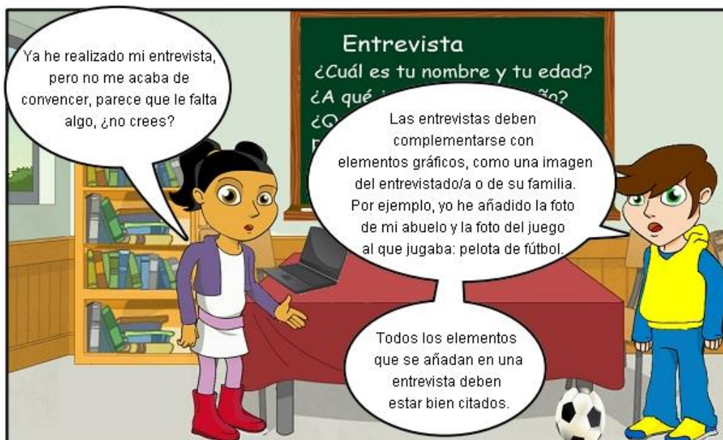
Ilustración. Elementos gráficos en una entrevista.