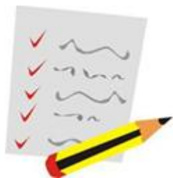
Ilustración. Competencias de esta propuesta didáctica.