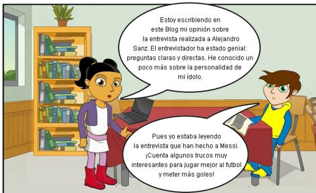
Ilustración. Leyendo entrevistas.