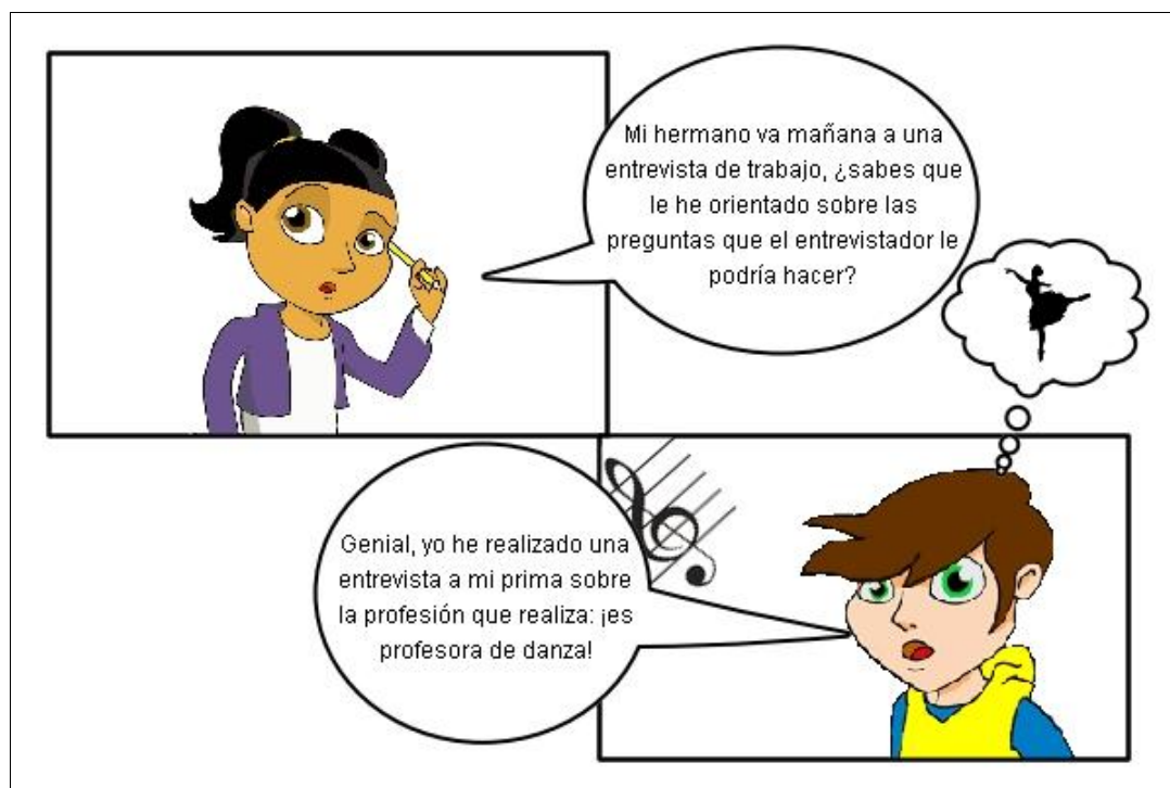
Ilustración. Comparación de entrevistas.