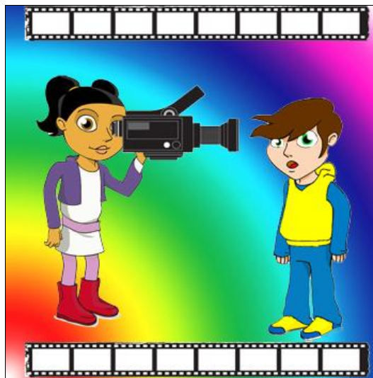
Ilustración. Juego de roles.

Al finalizar, junto al resto de compañeros y compañeras, participarás en un debate donde podrás analizar el por qué unos candidatos/as han superado la entrevista y otros no. Escucha las opiniones de los entrevistados/as y entrevistadores/as, serán muy interesantes. Tu docente, mientras tanto, irá tomando notas de cada una de las intervenciones en la Pizarra Digital.