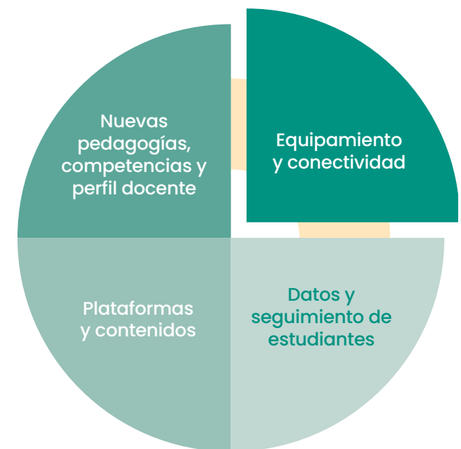
Figura 2. 4 pilares para una educación híbrida

Con base en la evidencia de otros modelos y en la experiencia de los países durante el cierre de las escuelas, se identificaron 4 pilares para el desarrollo de una educación híbrida.