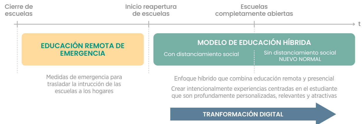
Figura 1. Fases de reapertura de las escuelas y modalidades de aprendizaje

cuando las escuelas estén funcionando. En la nueva normalidad se espera que se enfaticen experiencias centradas en el estudiante que sean individualizadas, relevantes y atractivas. En este contexto, las experiencias individualizadas son aquellas donde los estudiantes reciben instrucción y retroalimentación, según su ritmo de aprendizaje. 12 13